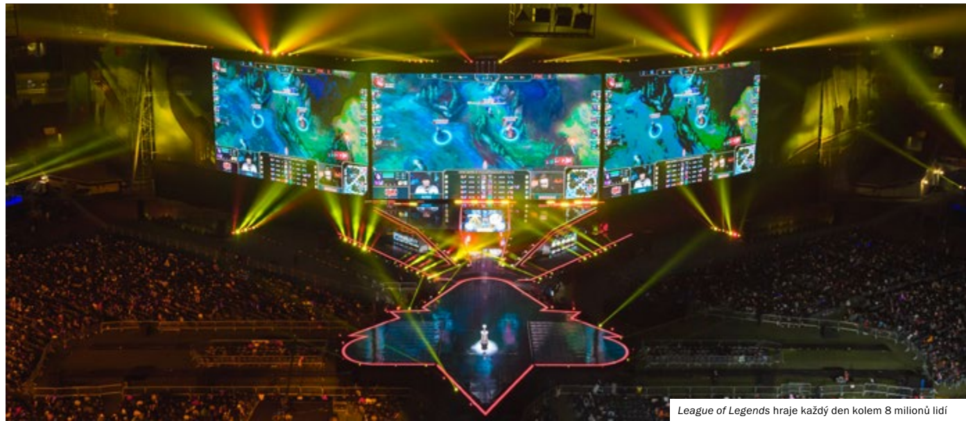
League of Legends hraje každý den kolem 8 milionů lidí