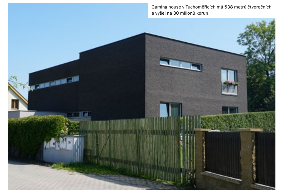
Gaming house v Tuchoměřicích má 538 metrů čtverečních a vyšel na 30 milionů korun

Jedním z cílů našeho týmu je zlepšit povědomí o gamingu. To se nám daří a jsem za to hodně rád, začíná se objevovat ve zpravodajství. Už se to nedá porovnat se situací před deseti lety. Doufáme, že za pár let to bude ještě větší. ►